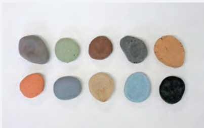
場所によって色が異なる ドパス