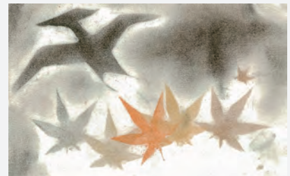
ドパスで描いた作品例